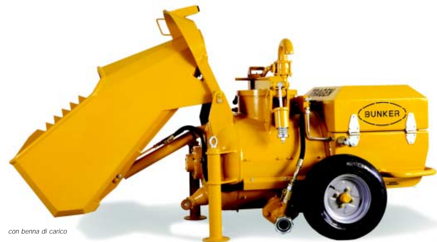
con benna di carico